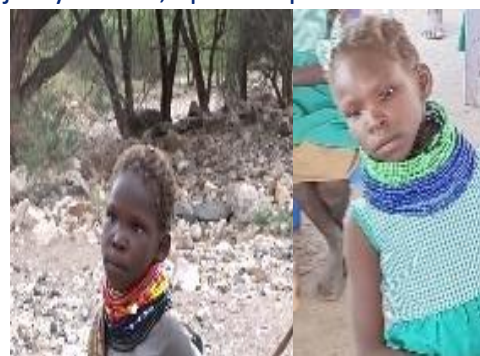
Pastorcita antes y después de ponerle el babi