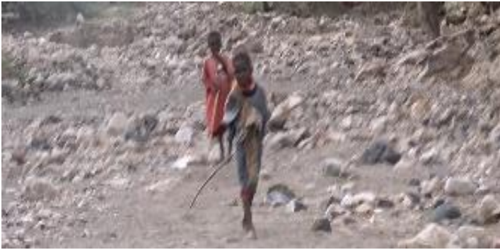
Caminos por donde van los niños a la escuela

En fin, os seguimos pidiendo vuestra ayuda para que la labor que se hace en esta misión de Kokuselej, de la que hemos tenido la suerte de participar, que siga adelante. Y que se produzca un desarrollo material y humano que permita a todas esas personas vivir con un mínimo de bienestar y dignidad, evitando de