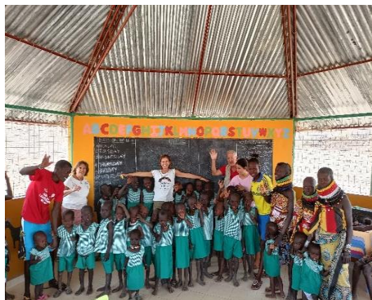
Niños y niñas con los babis que les hacemos en Madrid

Dentro de esa realidad encontramos muestras de la bondad íntima del ser humano, en la cara de satisfacción de madres y niños, cuando le das unos zapatitos o los babis que confeccionamos un grupo de personas en Madrid.