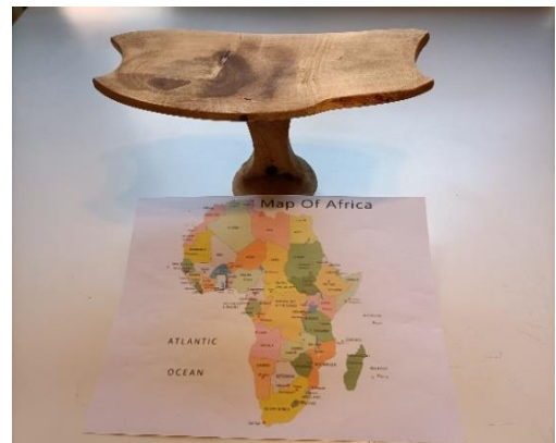
"ekicholón" utilizado por los pastores de Turkana, y mapa de África

Feliz verano y un fuerte abrazo para todos