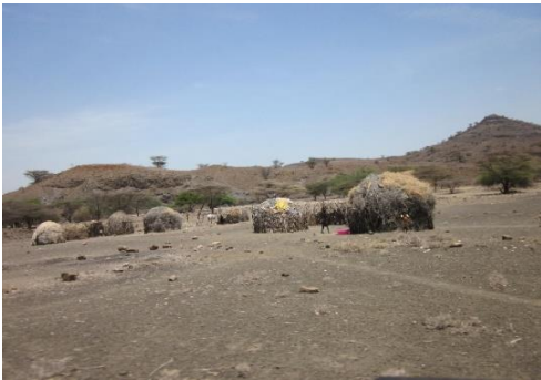
Poblado típico del área de Kokuselei

Me gustaría transmitirles nuestra experiencia del mes que hemos estado el pasado verano en la misión de Kokuselei. Ha sido todo un regalo el poder estar allí y ver la vida de otra forma; una vida donde el ser humano es el centro de todo lo que vives: las miradas, las sonrisas, el agradecimiento ante cosas