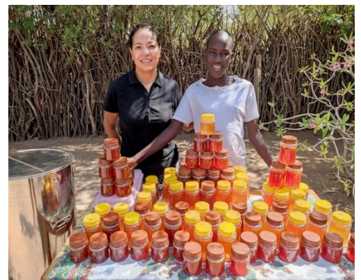
Misioneras envasando la miel

El cambio que se observa de año en año es espectacular. Las misioneras tienen un lema sacado de Éxodo 3, 17, donde Dios promete “sacarnos de las aflicciones para llevarnos a un lugar mejor, una tierra que mana leche y miel”, y desde el principio se pusieron con esta tarea. Crearon las Unidades Nutricionales, el dispensario, formaron a gente en agricultura, perforaron 33 pozos construyeron presas, etc. Desde el año pasado han conseguido tener dos vacas estabuladas que están produciendo leche y este año con los apiarios han conseguido producir miel. Por fin ¡ahora Kokuselei es una misión que mana leche y miel! Increíble, pero posible a fuerza de constancia e ilusión.